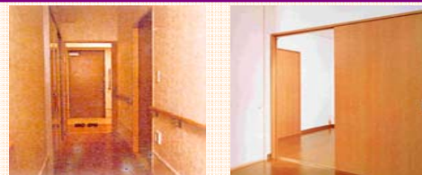
廊下や室内等のバリアフリー化