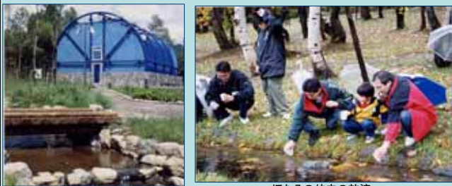
ほたるを観賞するためのドーム