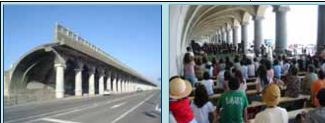
コンサート会場「稚内港北防波堤ドーム」