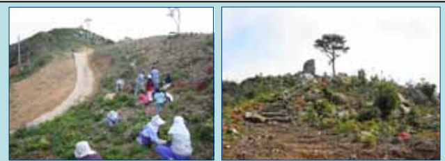
島民によるボランティア活動