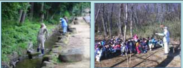
黒川婦人会による清掃活動