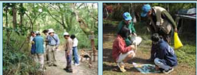
緑化保全のための植生・生物調査