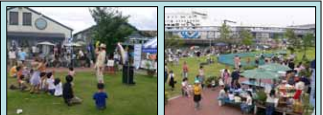
“かんたん”みなとまちづくりの活動の舞台