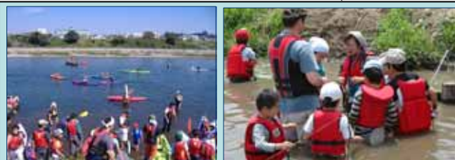
多摩川カヌー教室