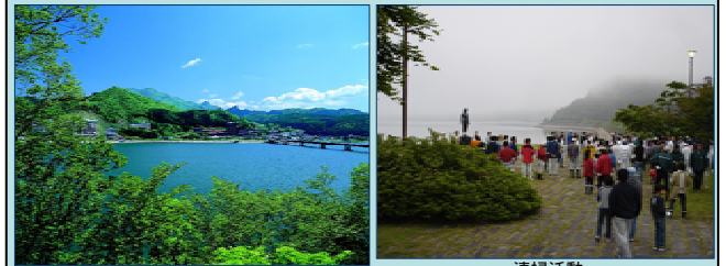
手つなぎ広場を望む