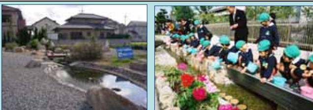
地下水位低下解消を目的とした地下涵養施設