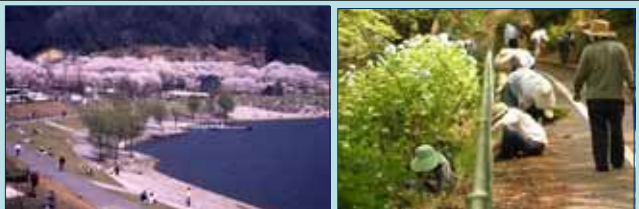
桜が満開となった八千代(土師ダム)湖畔