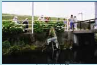
アジサイ街道の清掃

手づくり郷土賞受賞後、「春野町アジサイ街道」が5kmから5.5kmに延伸し、アジサイの町として定着しました。地域住民により良好な管理がなされるとともに、「あじさいウォーク」や「あじさいまつり」を開催するなど、町内外の方々に広く親しまれ、観光客数も、受賞当時4,000人が現在は、25,000人と6倍にもなっています。