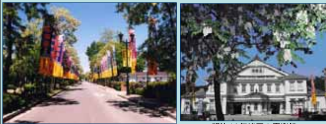
道路・歩道・水路等の改修を実施