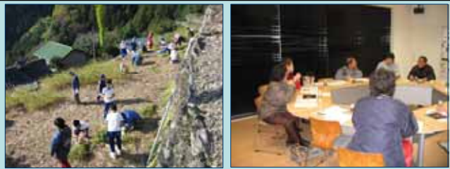
そばづくり体験(天日干し)