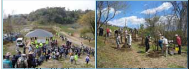
多くの児童、地域住民が参加