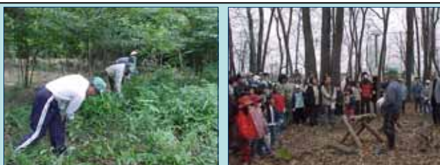
総合運動公園内緑地での下草刈り作業