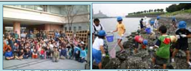
お台場の海で復活させた海苔養殖