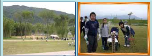
水辺の学校 ぶぶるパークみかも