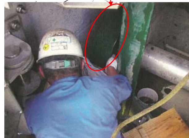
超音波探傷試験の実施状況(主ローラ) ※現地で実施している状況(今回調査)