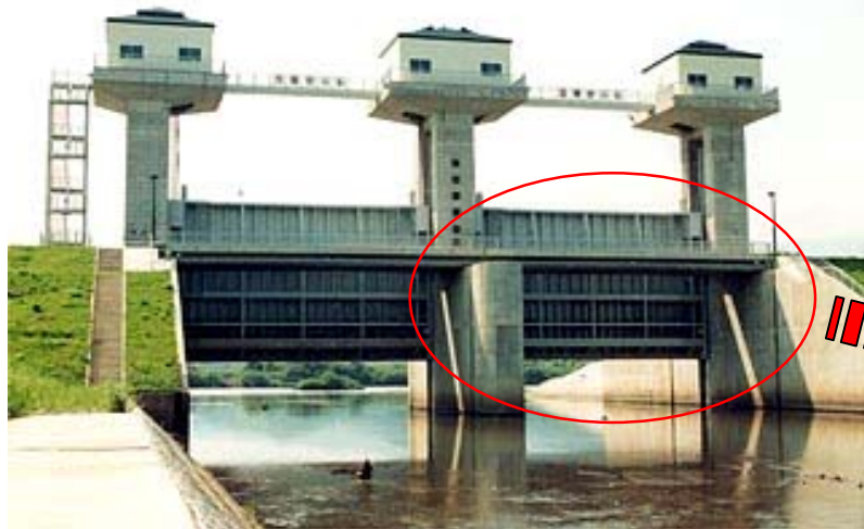
河川用ゲート(水門)設備の全景