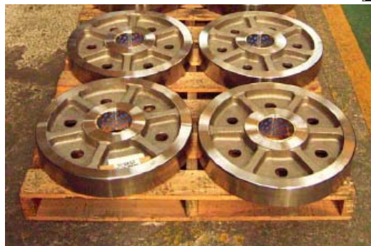
主ローラの外観(加工後)