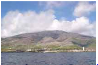
⑨ 東京都三宅村 危機管理をテーマとした 交流人口増加の取組