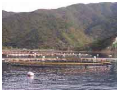
④ 鹿児島県宇検村・瀬戸内町 奄美大島のクロマグロ養殖