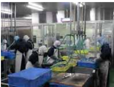
① 島根県海士町 遠隔立地を克服する離島の漁業