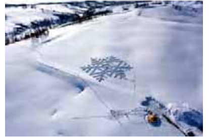
⑧ 北海道沼田町 豪雪地帯の雪冷熱技術の活用