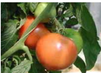
⑦ 高知県室戸市 海洋深層水の多角的利用