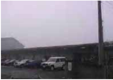
② 山形県村山地域 豪雪地帯のニーズに応える 小さなクラスター