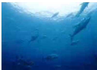
⑤ 和歌山県串本町 半島地域のクロマグロ養殖