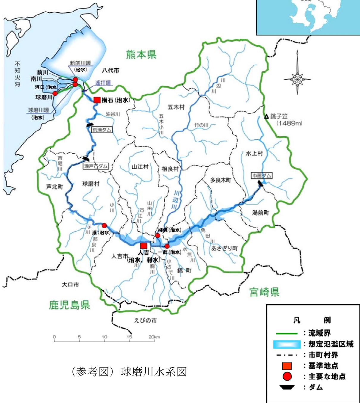
(参考図) 球磨川水系図