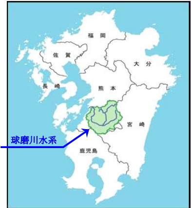
球磨川水系位置図