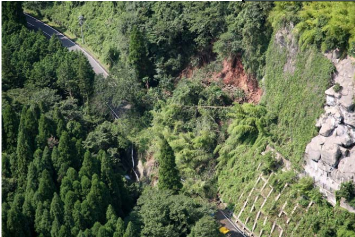
主要地方道三重野津原線