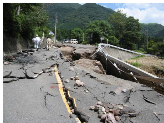
①ブロック積み及び路面の被災