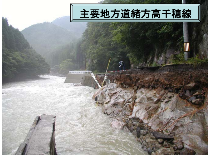
主要地方道緒方高千穂線