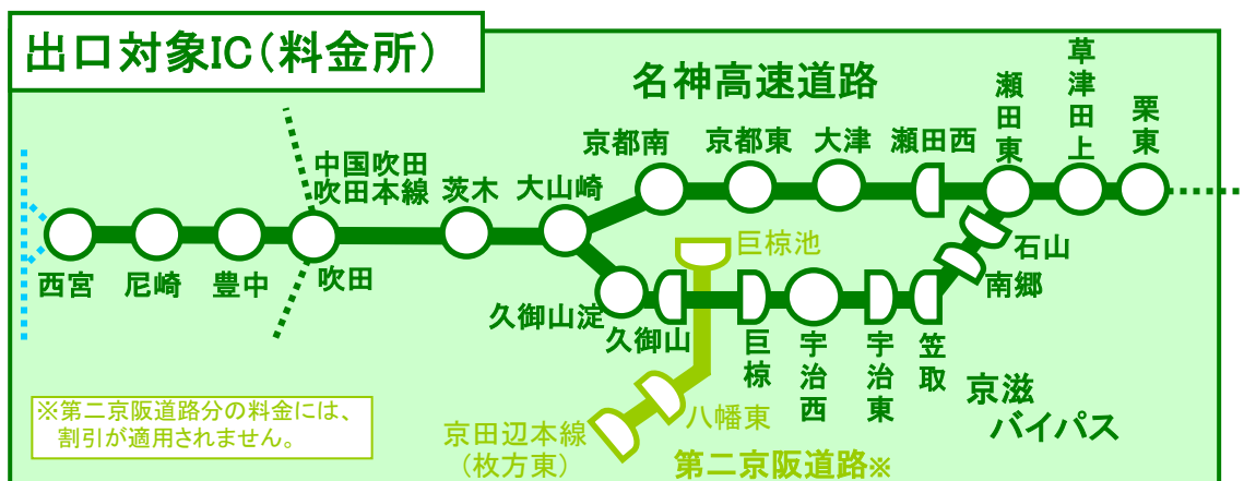
《 主要IC間の社会実験料金(大型車料金) 》