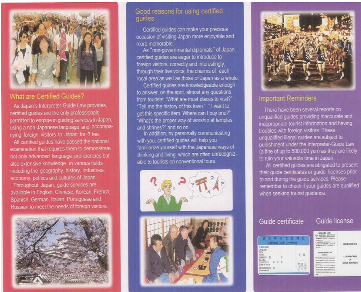
(広げるとA4の大きさ)