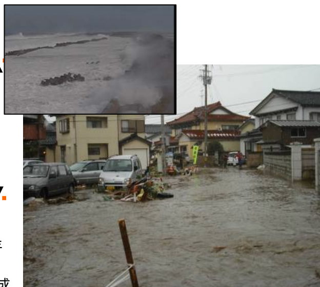
高波被害(平成20年2月24日、入善町芦崎地区)