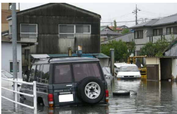
沼川流域の浸水状況(静岡県沼津市)