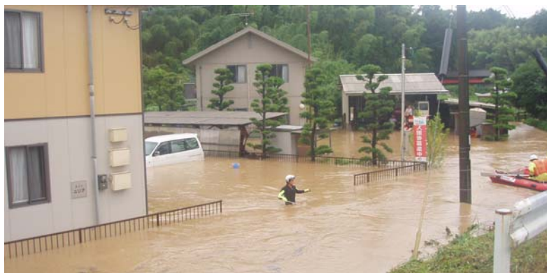
緑川の浸水状況(熊本県甲佐町)