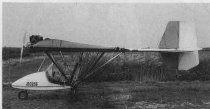
側面写真 (基本仕様)