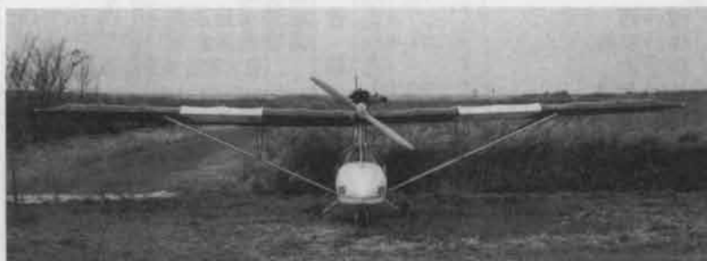
正面写真 (基本仕様)