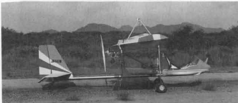
側面写真（基本仕様）