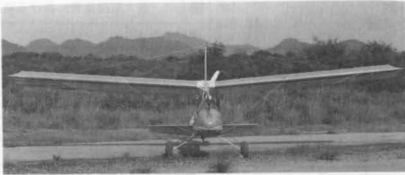
正面写真（基本仕様）