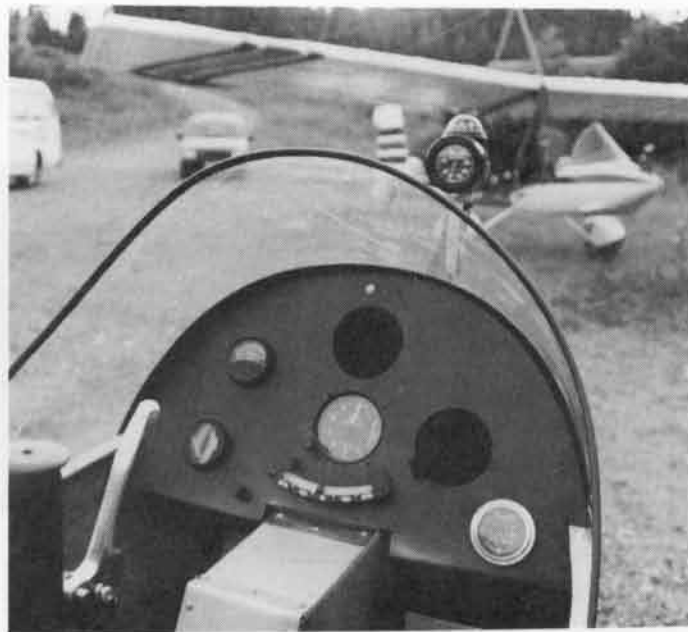
操縦席写真(基本仕様)