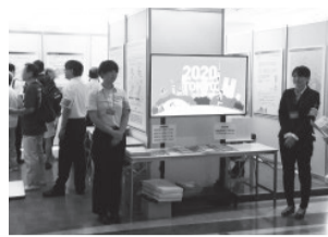
7月24日～27日・大田区役所本庁舎1階南側ロビー