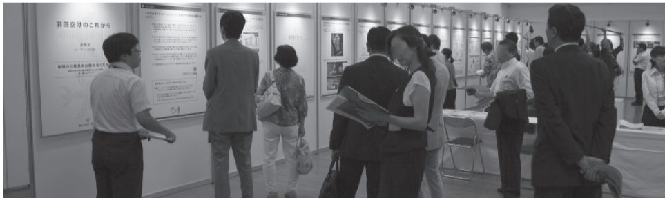
説明会の様子（7月21日～22日・タワーホール船堀 展示ホール2）

寄せられた意見については、意見の内容ごとに整理し、できるだけ積極的に発信し、幅広く共有する予定です。