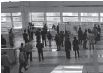
市民相談会(千葉市会場)の様子

また、各地域の皆さまのご関心に応じた形で、パネルや映像資料などを用いた情報提供が行われました。