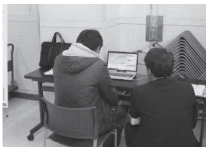
市民相談会(木更津市会場)の様子