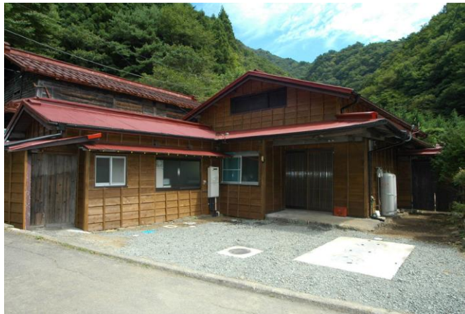
改修後の生活体験施設（渡邊邸）