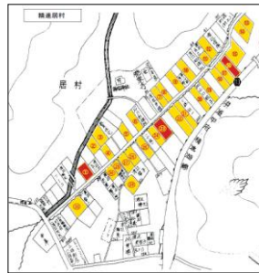
【居村地区の空き家状況 (黄・赤=空き家)】