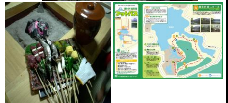
【フットパス (左)、料理体験 (右)】