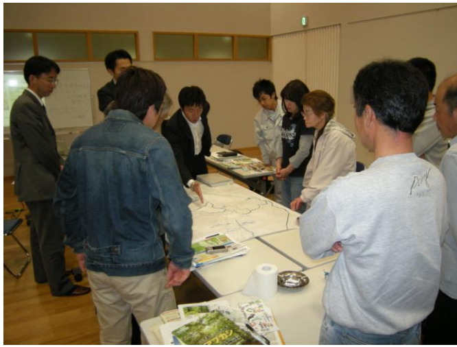
専門講師を交えてのプログラム作成