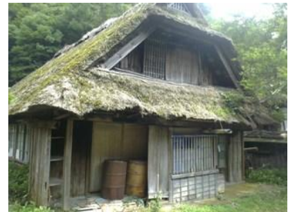
【徐々に再生が難しくなる空き家】