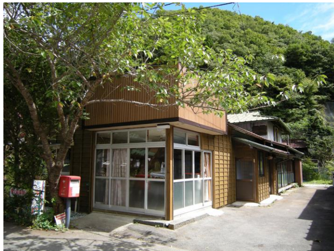
改修後の生活体験施設（小林商店）