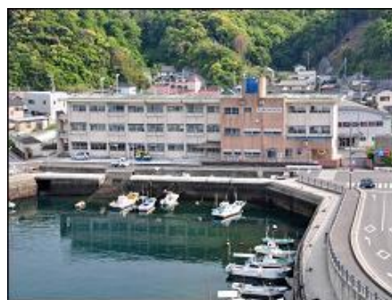
【廃校となった中学校の全景】