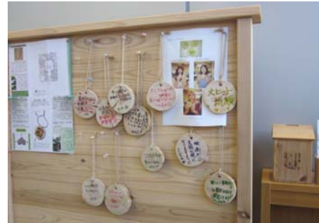
市民協働センターで木札チャリティ・映画女優も協力