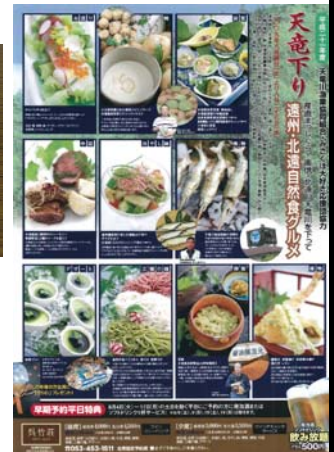
【ホテルの創作グルメ企画】