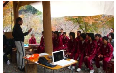
【自然の中で中学生の思春期講座】