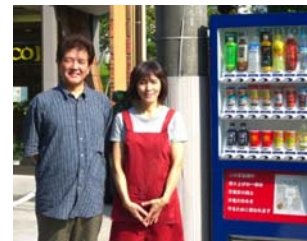
【自動販売機の設置】

—応援団として飲料水メーカー(サントリー・東海ペプシ)が自動販売機の設置協力があれば、売上に対して森林を守る基金への寄付を拠出してもらえるようになり、設置協力事業所(3事業所、5箇所)も出てきた。