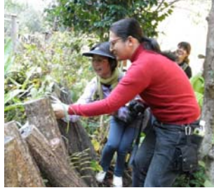
【シイタケの菌打ち体験】