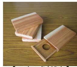
【ヒノキの名刺入れ】

—都市部の菓子店が水窪の資源(栃の実)を使った“スイーツ”を本格販売する方向で進んでおり、その収益金の一部を森を守る基金に寄付する流れができた。