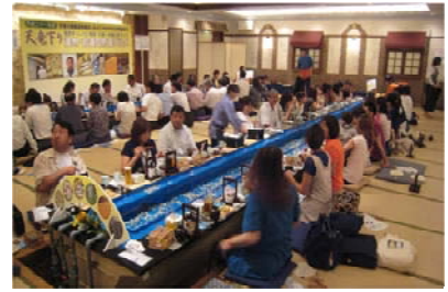
【自然食創作グルメ実施・8月の2週間】