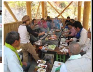
【ワンワンの森に交流の場】