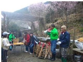
【森林環境学習のプログラム構築】

—浜松市は本年度より「てんはまエコミュージアムの案内人」養成を始めたが、そのプログラムとフィールドの1つに加えられる。