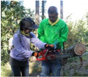
【チェーンソー体験】