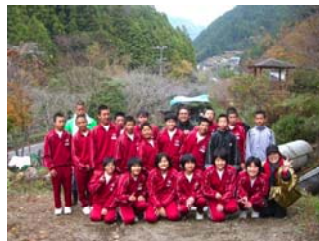
【自然の中で中学生の思春期講座】