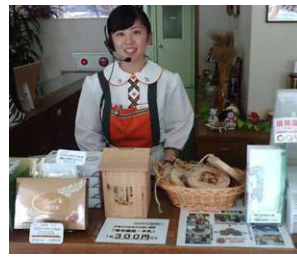
【木札募金の取扱店】

—市有林(ワンワンの森)を市民交流の森とすべく、手づくりのバーベキュー小屋をつくり、交流の場ができた。