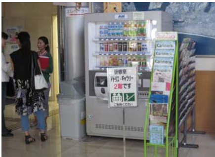
市民協働センターの自動販売機での資金集め