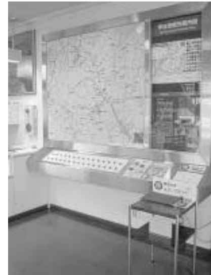
宇治市観光センター