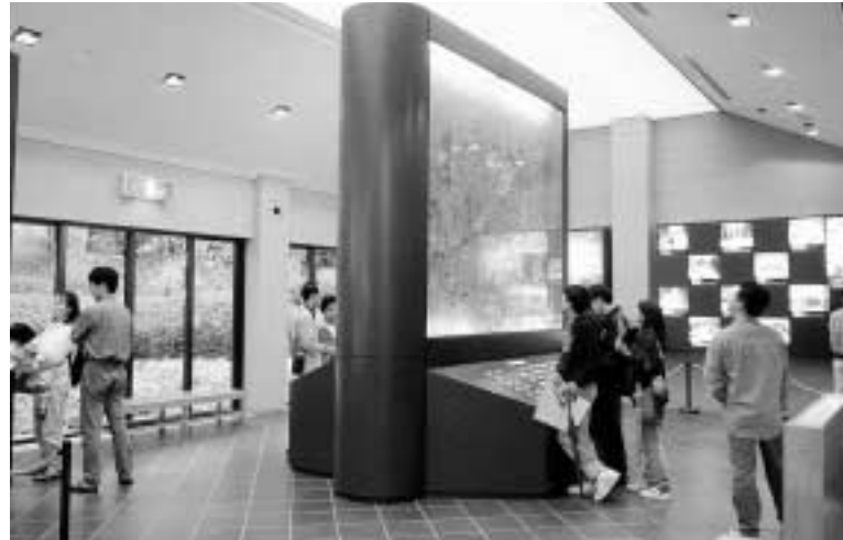
国営飛鳥歴史公園館

iセンター(歴史街道案内所)は、現地での歴史街道各地の情報サービスの核となる施設です。 歴史街道各地でiセンターづくりがすすめられています。