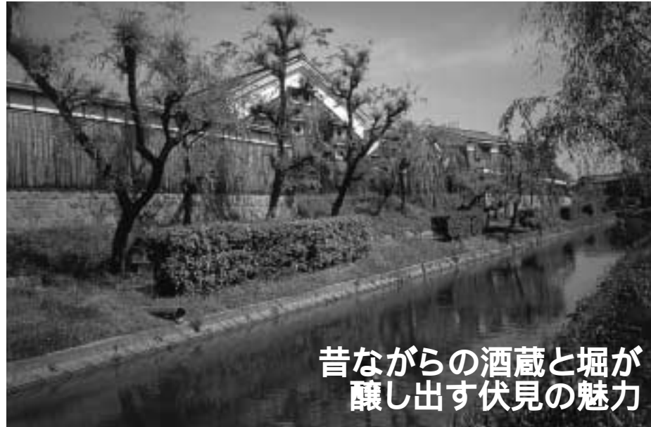
昔ながらの酒蔵と堀が醸し出す伏見の魅力