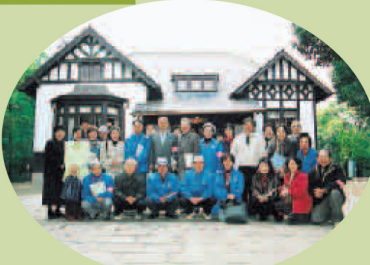
呉観光ボランティアガイドの会（入船山記念館にて）