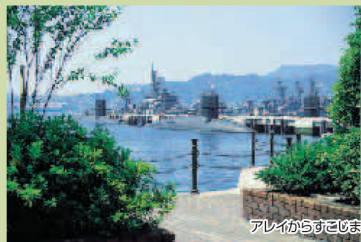
アレイからすこじま

■行き方：JR呉駅前バス停3番乗り場から「呉倉橋島線」または「阿賀音戸の瀬戸線」に乗車（「潜水艦前」下車）、徒歩1分（料金210円、5便/時間、呉市交通局営業センター）