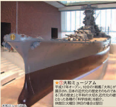
大和ミュージアム

★①大和ミュージアム 平成17年オープン。10分の1戦艦「大和」が展示され、日本の近代化の歴史そのものである「呉の歴史」と平和の大切さ、近代化の礎となった各種の「科学技術」を紹介。休館日：火曜日（休日の場合は翌日）