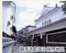
御手洗町並み保存地区

■行き方：①呉港から航路で約1時間（大長港下船、料金2,590円、5便/日、広今あきなだ高速）②仁方港から航路で約28分（大長港下船、料金1,910円、4便/日、山陽商船）③三原港から航路で約54分（大長港下船、料金2,050円、5便/日、山陽商船）④竹原港から航路で約35分（大長港下船、料金1,130円、8便/日、山陽商船）