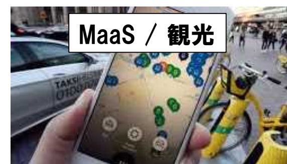
MaaS / 観光