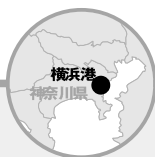
●横浜市内放置艇隻数

横浜ベイサイドマリナー係留契約隻数は平成15年で1,068隻（うち放置艇371隻）、アウトレットモール来訪者数は約320万人（平成15年度）。