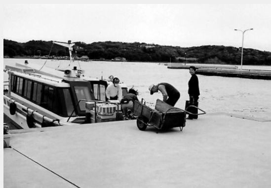
防波堤・物揚場の整備により利便性が向上した港内の状況。観光客の更なる増加への住民の期待は大きい