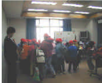
児童集合場所(A・B・Cグループ毎)