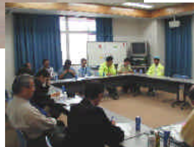
運営スタッフ反省会