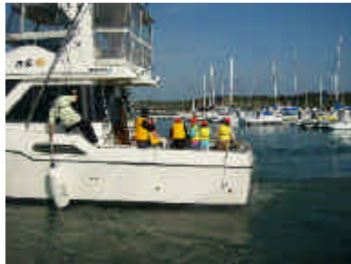
銚子マリーナを出港