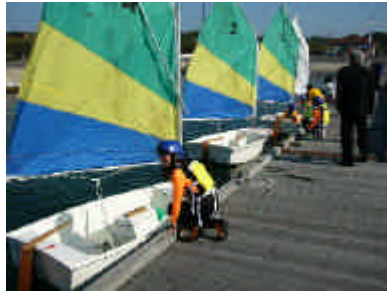
ディンギーヨットへの乗込み