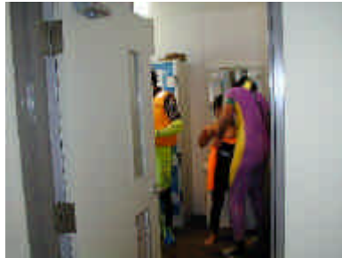
ヘルメット・ライフジャケットの装着

デインギーヨット8隻(OP級) OPコーチ10名(6YCC、千葉県SR、東京都SR、東京都FJ、神奈川県FJ) レスキュー艇 3隻(ゴムボート) 指導員9名(各艇に3名 SYCC、県連、CYC、ホビー協会) ウエットスーツへの着替え(デインギーハウス更衣室) マリンブーツの装着