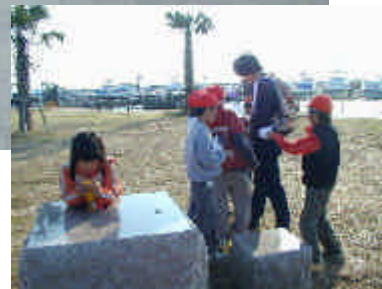
アンケート記入風景