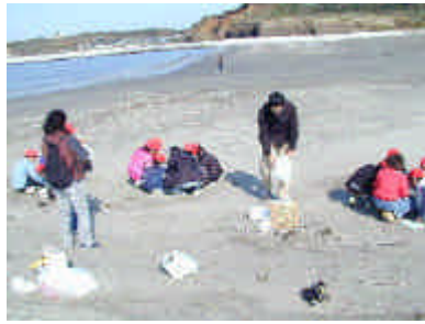
小グループ別で収集した漂着物を整理