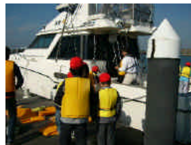
屏風が浦～犬吠崎へ(約1時間の体験乗船)