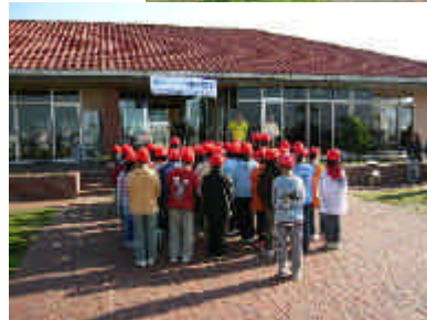
銚子マリーナ清水支配人からの挨拶