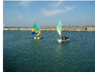
ディンギーヨットの操船体験