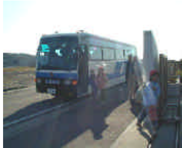
参加児童の送迎大型 中型バス