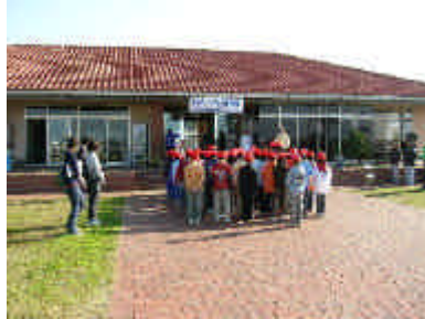
看護師さんの紹介