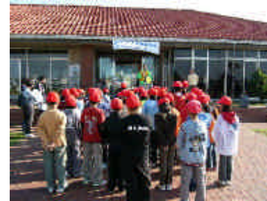
オリエンテーション