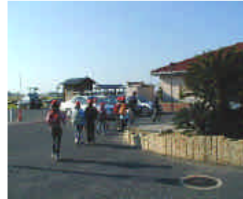
児童の引率(明神小学校より学年担任教師が引率)