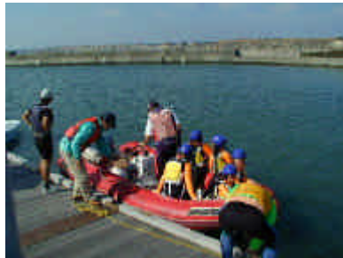
ゴムボート（レスキュー艇兼用）の乗船