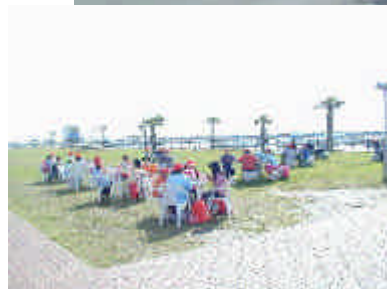
昼食（センターハウス前広場）