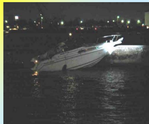
花火大会を観覧し帰港中、防波堤に衝突 乗船者4人中3人は骨折等により入院