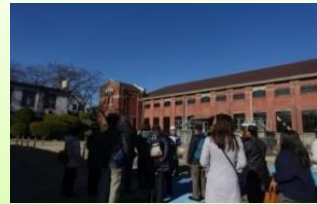
旧三河島汚水処分場唧筒場施設