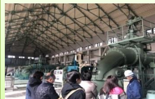
旧三河島汚水処分場唧筒場施設