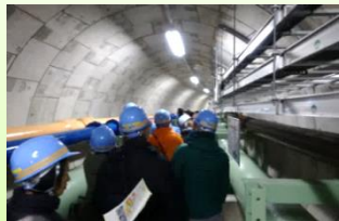
北多摩二号・浅川七間連絡管