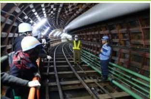
第二田柄川幹線その2工事現場