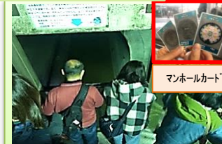
マンホールカード