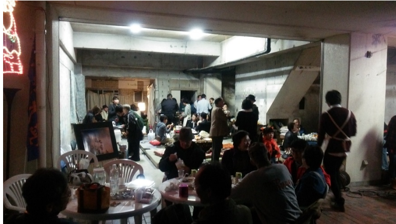
図3 おいでよ！アツとほーむ

りするなど関心を示し、イベント当日は高齢者から乳幼児まで250人が参加した。2回目以降は、学生と学童の交流や、学生による研究発表など多様に変化しながら、2015年までに数回行われた。