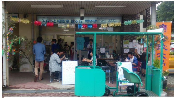
図5 学生が集う館ヶ丘団地の「ふらっと相談室」