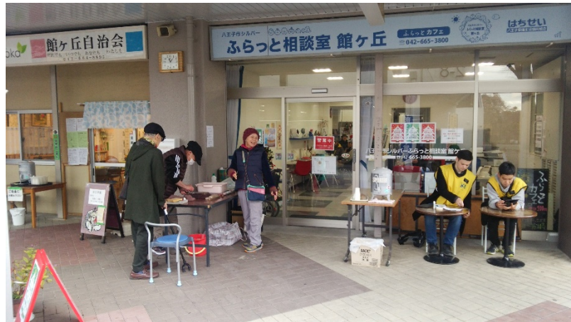
図2 ふらっと相談室 館ヶ丘