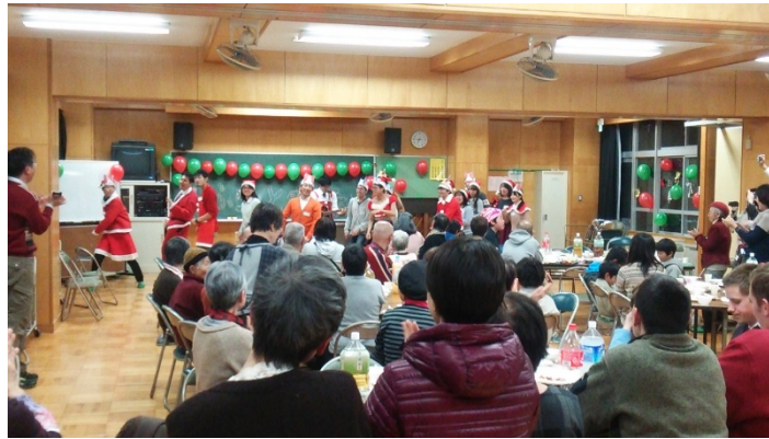
図4 学生と住民の交流 (写真は「ふらっと感謝祭」と称するイベント)

処分を依頼された学生が、団地で開かれたイベントの際、それらの本を誰でも自由に持ち帰れるように展示した。ただし、持ち帰る際、本の感想や元の持ち主に向けた一言を書くカードを渡し、本を仲介して人がつながれる仕組みとした。