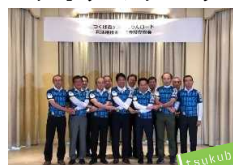
協議会の設立総会