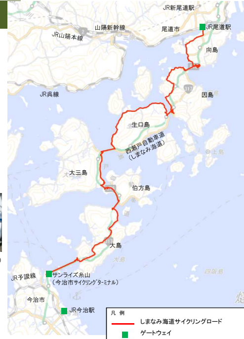
凡例 しまなみ海道サイクリングロード ゲートウェイ