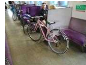
しまなみサイクルトレイン(JR四国)