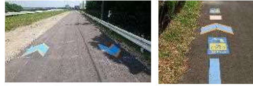
(矢羽根とルート案内)