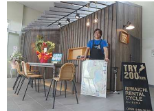
レンタサイクル の拠点整備 (米原駅 サイクルステーション)

サイクルサポートステーション (トイレ・ポンプ貸出、 休憩所等308カ所:R1.7現在)