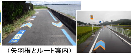
(矢羽根とルート案内)