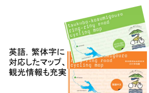
英語、繁体字に対応したマップ、観光情報も充実