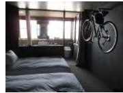
ONOMICHI U2 (サイクリスト専用ホテル)