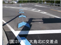
(国)317号 大島北IC交差点