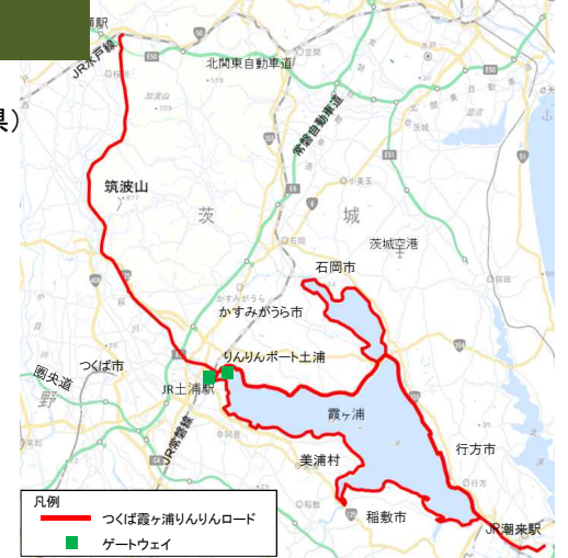
凡例 つくば霞ヶ浦りんりんロード ゲートウェイ