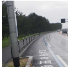
植栽帯を活用した空間創出例