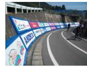
企業協賛によるセーフティマット設置等(45社協賛)