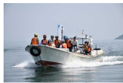
湖上交通活用例 (守山市 漁船タクシー)