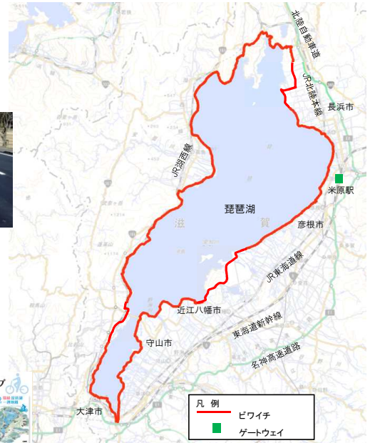
凡例 ビワイチ ゲートウェイ