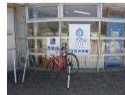
サイクルオアシス (約150箇所H30.9現在)