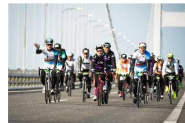
サイクリングしまなみ2018