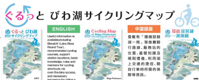
マップ (日・英・中(繁) 3言語版を作成)

サイクルサポートステーション (トイレ・ポンプ貸出、 休憩所等308カ所:R1.7現在)