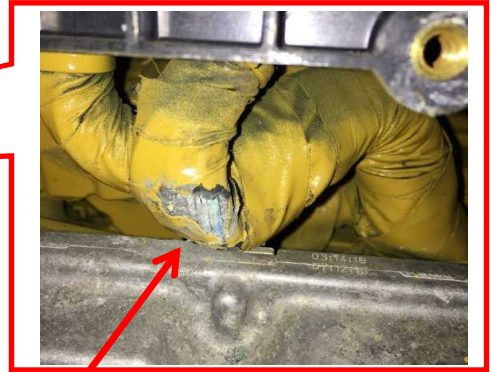
エンジンコントローラ配線