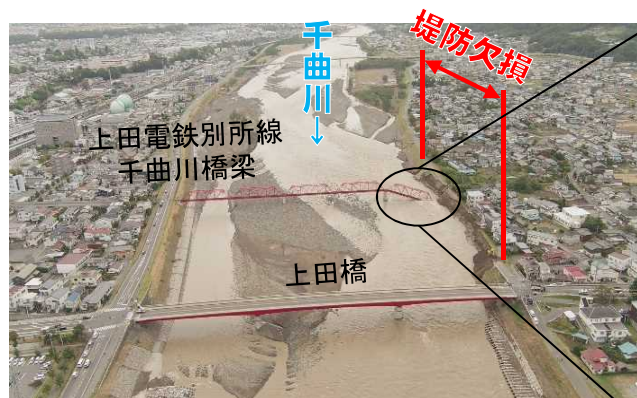
上田市諏訪形地区 被災状況