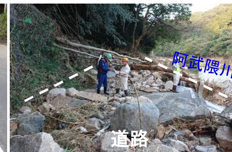
国道349号 土砂崩落・路肩流出