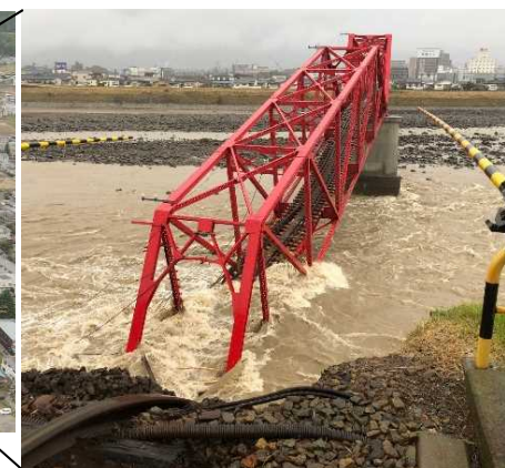
上田電鉄別所線千曲川橋梁の落橋状況