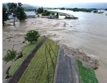
千曲川長野市穂保地区堤防決壊状況