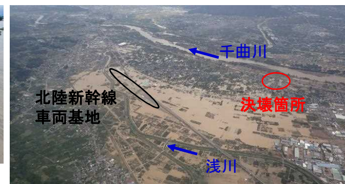
長野市穂保地区 浸水状況