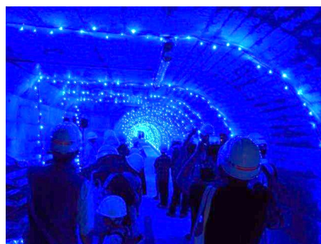
七ヶ宿ダム 監査廊イルミネーション（宮城県）

※国土交通省では、地域活性化のため、インフラをよりご理解いただくためにインフラツーリズムを推進しています。