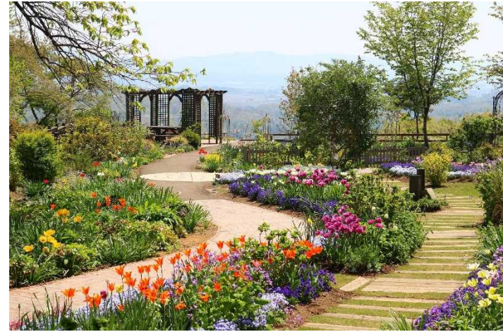
船岡城址公園(柴田郡柴田町)