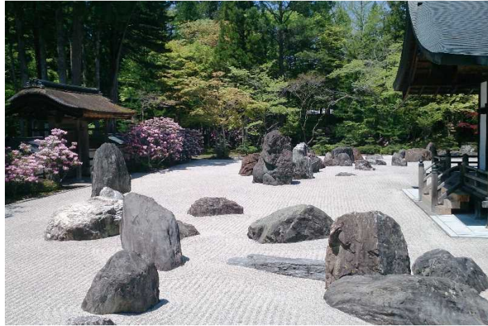
金剛峯寺蟠龍庭(伊都郡高野町)