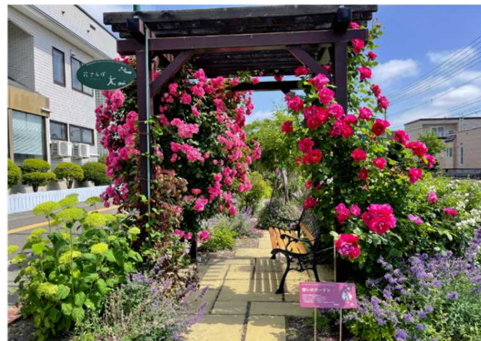
ガーデンギャラリー(恵庭市)