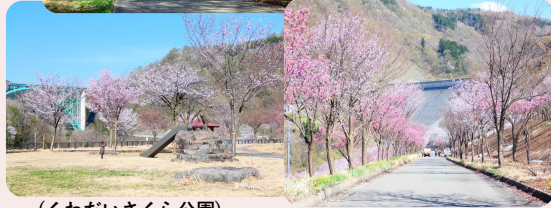
(くわだいさくら公園)