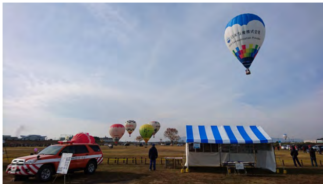
三重河川国道事務所の展示ブース