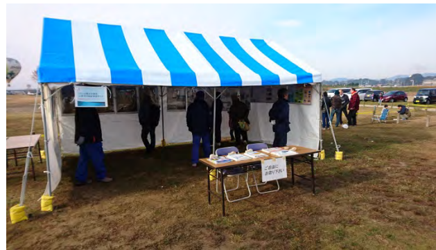
パネル展示の状況