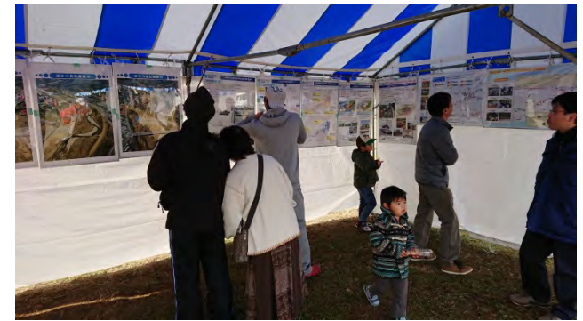
パネル展示のテント内の様子