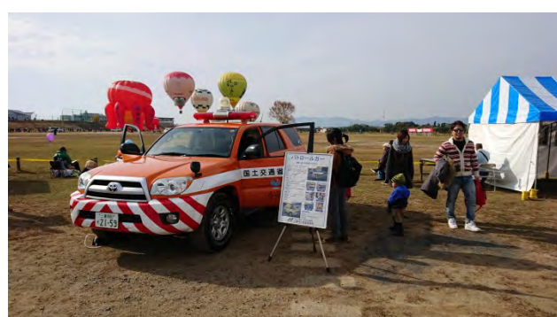
河川パトロール車両の展示