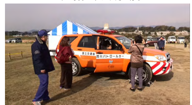
河川パトロール車両への乗車体験