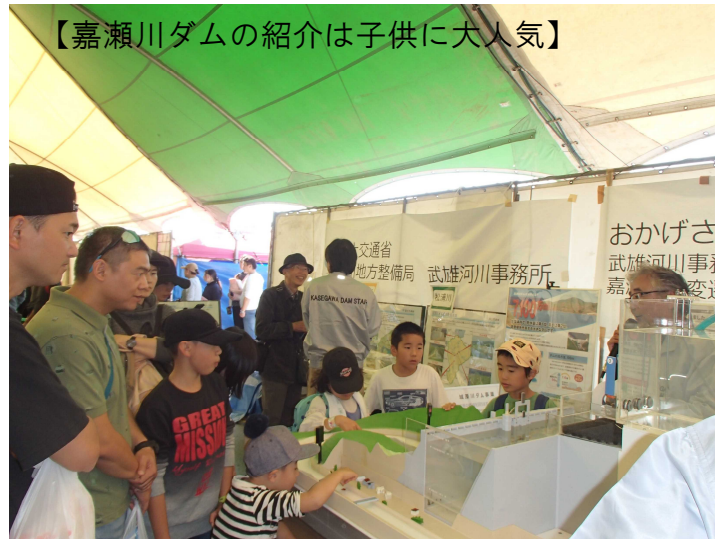
【嘉瀬川ダムの紹介は子供に大人気】