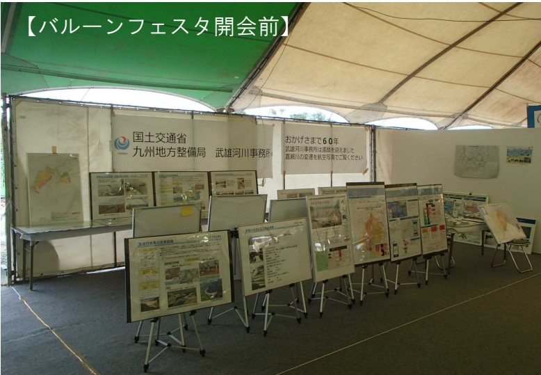
【バルーンフェスタ開会前】