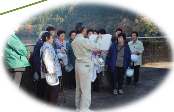
当時日本一の高さを誇った丸山ダム建設の話に興味津々