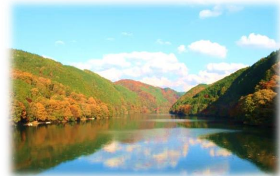
木々が色付き始めた丸山ダム貯水湖