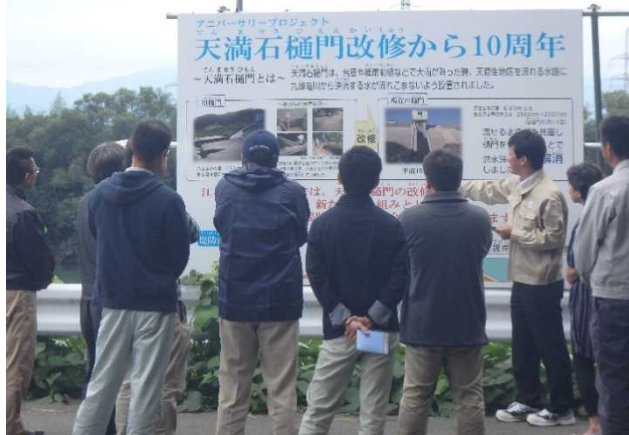
パネルを使った事業説明