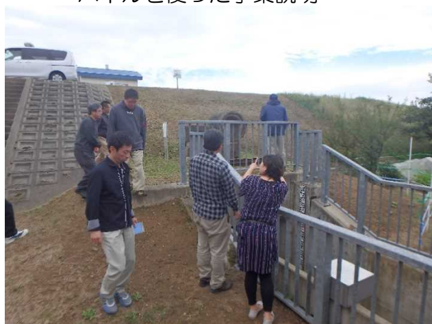
天満石樋門の見学