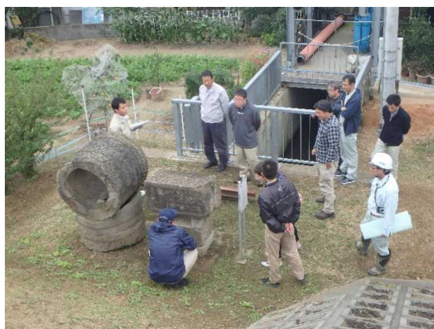
天満石樋門改修の記念碑見学