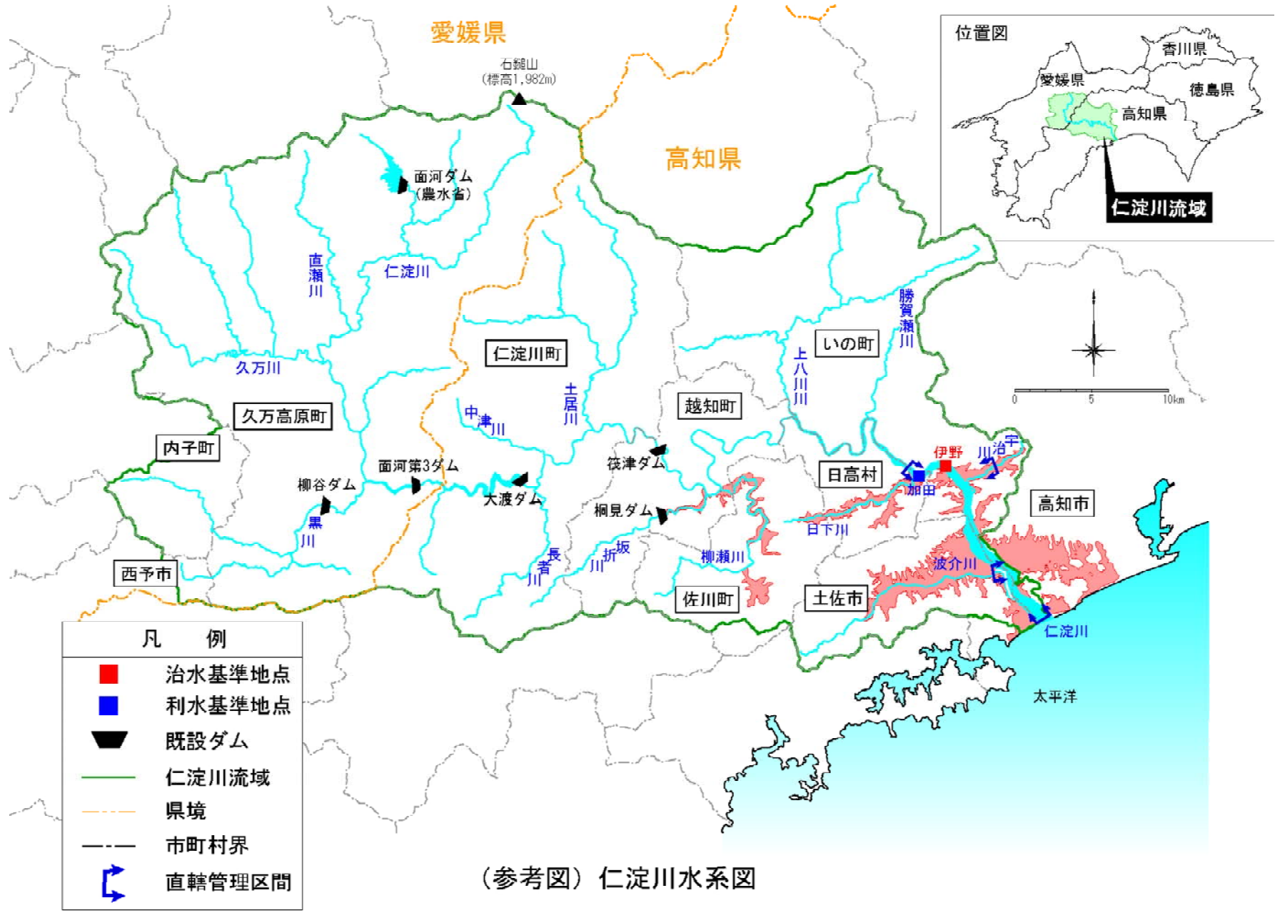
(参考図) 仁淀川水系図