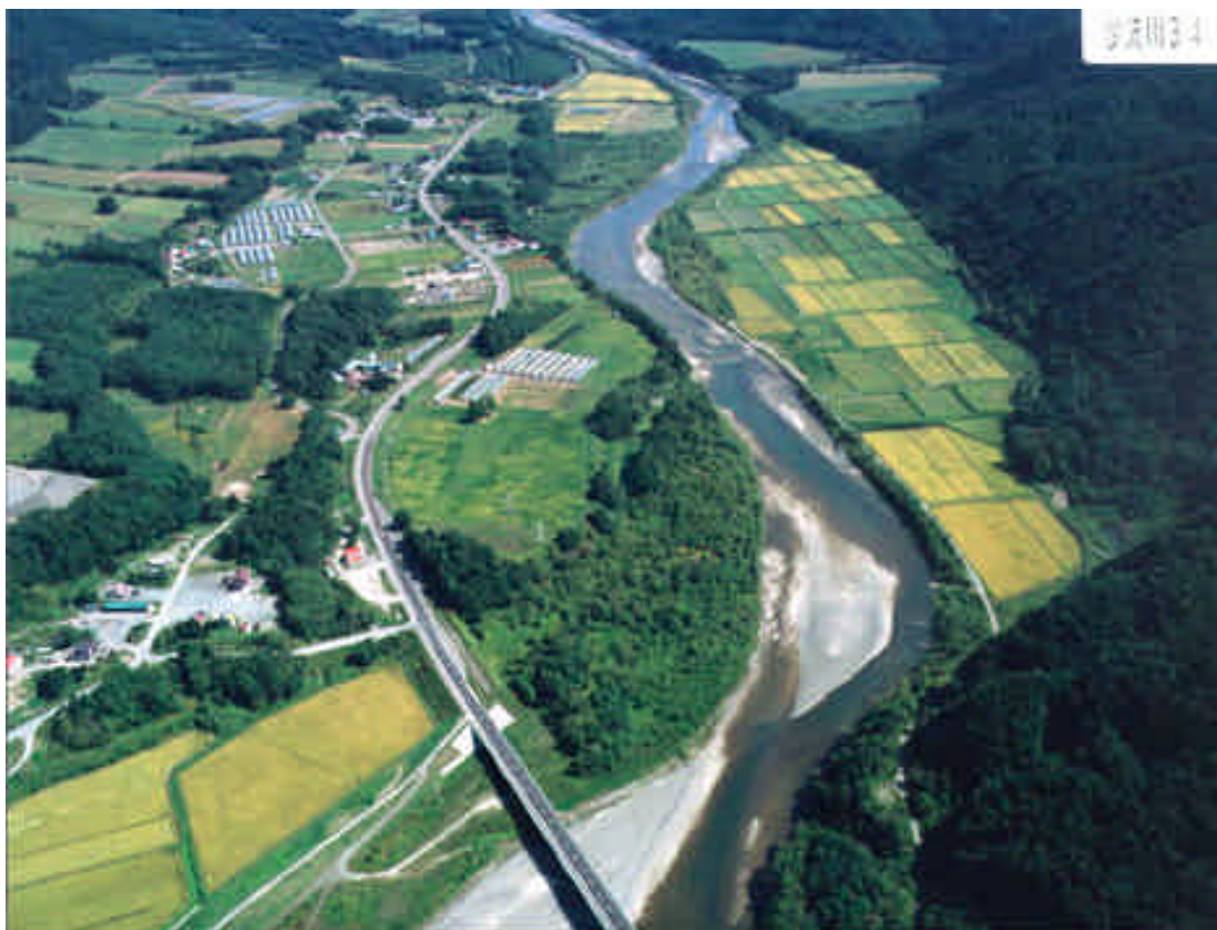
写真 3-3 沙流川中流部

河道内の植生は、カラムツやヤナギ類が河岸近くまで迫り、哺乳類は、中流部から下流部ではエゾリス、シマリスなどが生息し、鳥類は、河岸にカワセミ、平野部にイソシギなどの河川性の種が生息する。魚類は、サクラマス、ハナカジカなどが生息する。