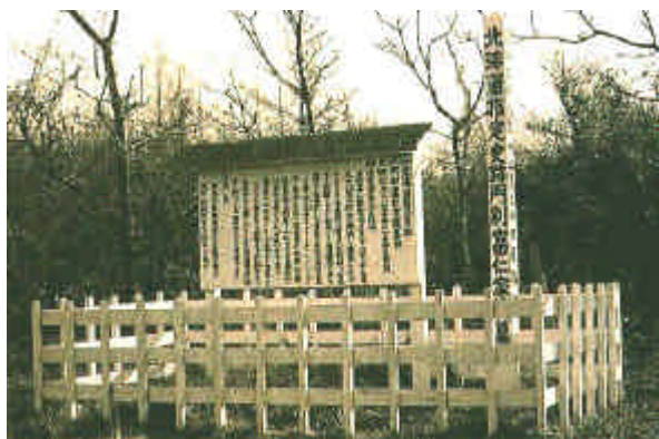
富仁家墳墓群・北海道指定史跡（門別町史）