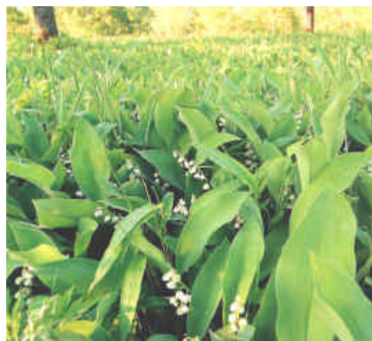
平取町 スズランの群生地