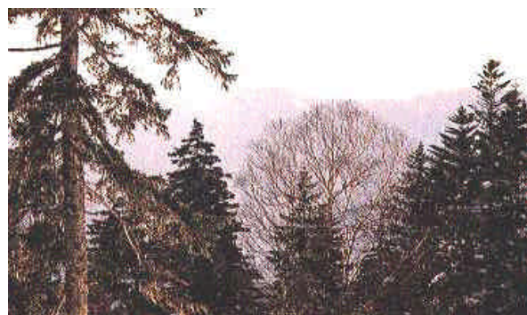
沙流川源流原始林