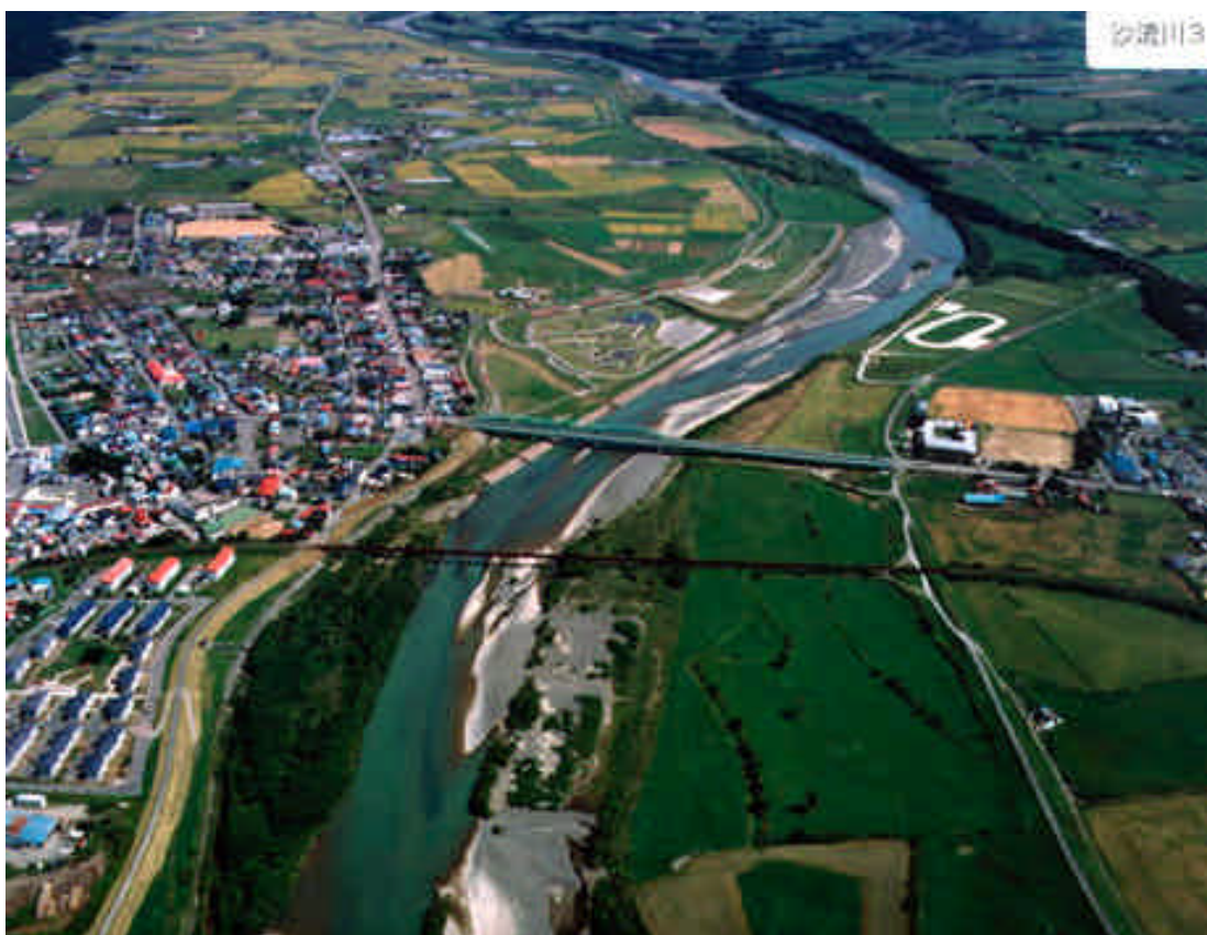
写真 3-4 沙流川下流部

鳥類は、ヒシクイ、ヨシガモなど、河口部では天然記念物のオジロワシ、オオワシなどが確認されている。魚類は、コイ、ハゼなどが生息し、シシャモ、サケ、サクラマス等が遡上する。