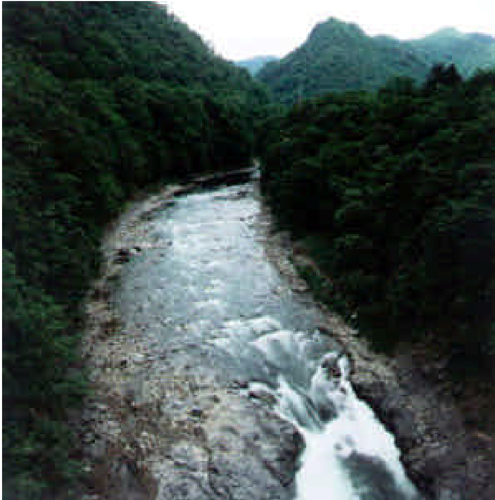
写真 3-1 沙流川上流部

河道内の植生は、河岸及び隣接地にエゾマツ、トドマツの針葉樹林が見られ、哺乳類は、貴重種のナキウサギ、エゾクロテンや大型獣のエゾシカ、ヒグマなどが確認され、魚類は、清流にすむオシヨロコマ、サクラマスなどが生息する。