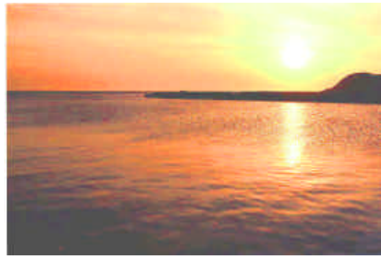
門別町 太平洋にそそぐ