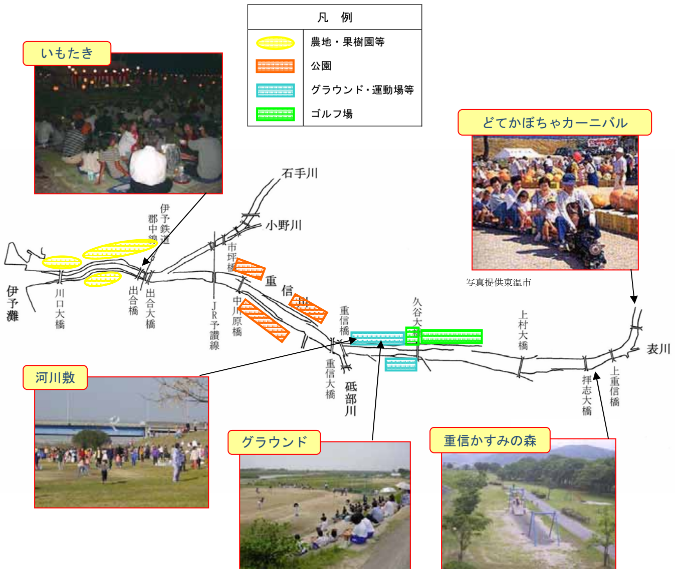
図 7.2.2 重信川の河川利用状況

重信川の中流域から河口では、図 7.2.2 に示すように重信川の高水敷はゴルフ場、公園、グラウンド、運動場等の施設があり、多くの人々に利用されている。また、様々なイベントも行われている。