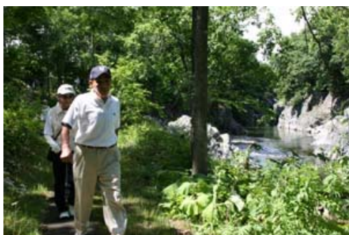
写真 7-3 溪谷ウオーク