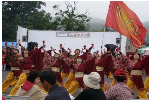
写真 7-2 夏に恋まつり