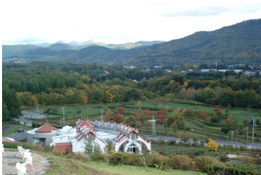
写真 7-1 溪谷公園

渚滑川における河川利用状況は、主に採草地として利用されているが、緑あふれる自然が豊富にあることが特徴的であり、上流の滝上町では、パークゴルフ場やキャンプ場を備えた溪谷公園や遊歩道が川に沿ってあり見事な溪谷美と溪流、大小の滝を見ようと多くの人々が訪れている。また、河川空間を利用した「芝桜まつり」、「夏に恋まつり」、「溪谷ウオーク」等の様々なイベントが開催され多くの市民に利用されているほか、本格的な溪流釣りの場として多くの人々が訪れ、スポーツフィッシングのメッカとして全国のファンから注目を集めている。