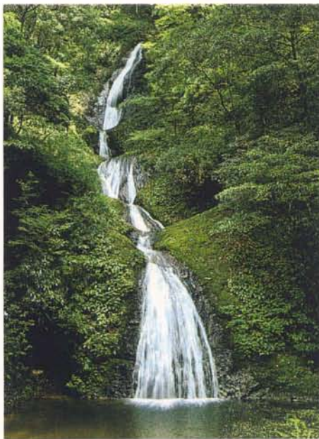
阿寺の七滝 (鳳来町)

鳳来町の巢山高原から流れる水が、礫岩の断層崖を落下して、全長64mにわたる7段の階段状の曲線美を描いて、深い滝つぼに落ちる姿は幽玄そのものである。上から2番目と5番目の滝つぼは大きな おうけつ 甌穴を持ち、礫岩にかかる