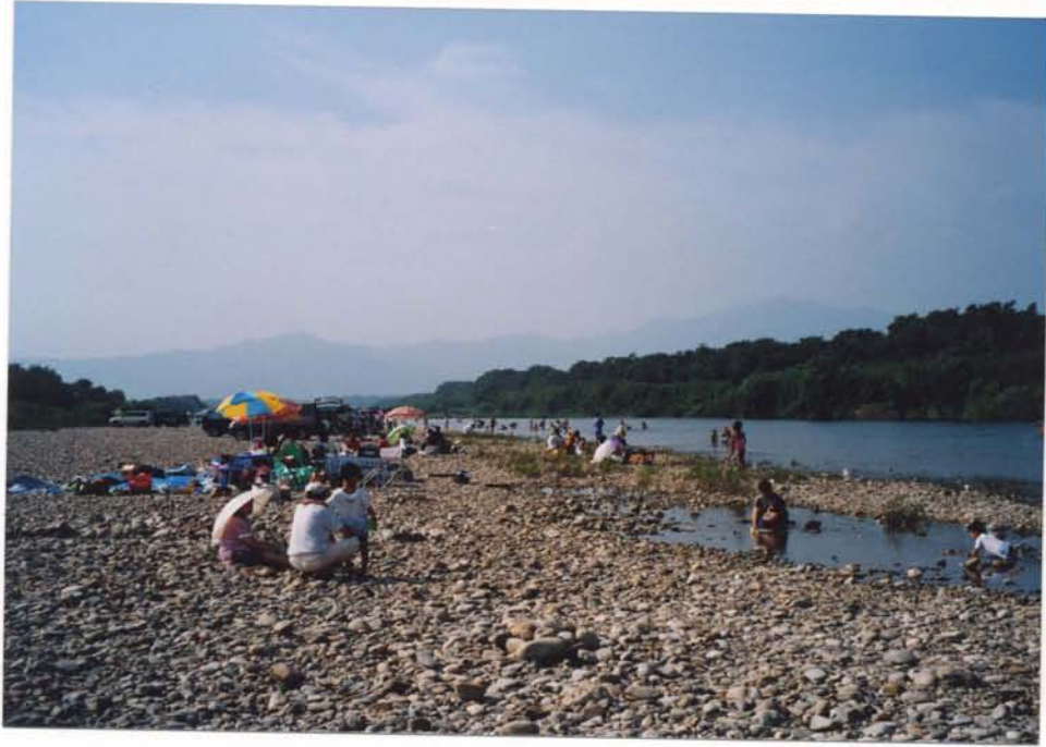
三上橋上流（豊川市）