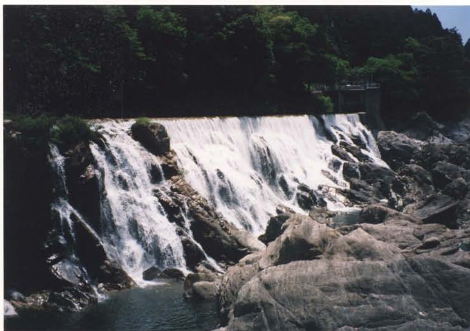
花の木ダム（長篠発電所堰堤、新城市）