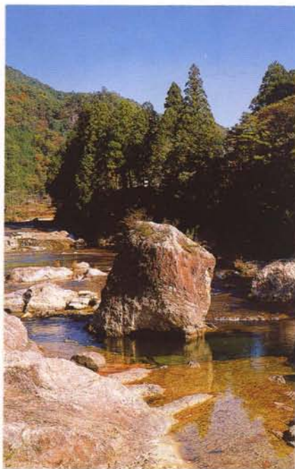
鳳来峡・板敷川（宇連川、鳳来町）

道内の樹木やヨシなどが水際まで繁茂するとともに、清冽な水質が保たれ、豊橋市等の都市化が著しい地域にあって、下流域に残された貴重な自然環境と河川景観を提供している。