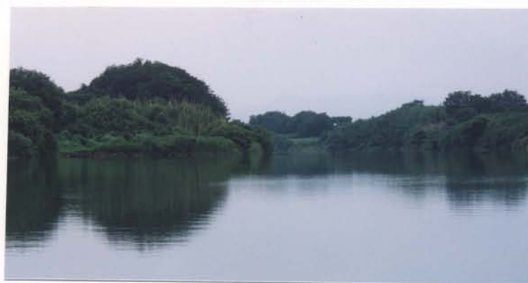
豊川河道内樹木（豊橋市）