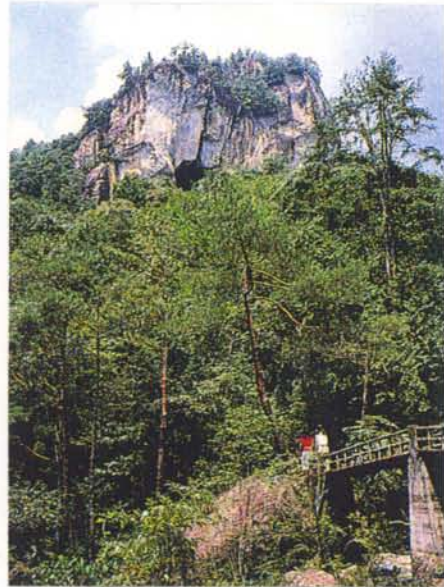
乳岩及び乳岩峡 (鳳来町)

宇連川支流の乳岩川に沿う峡谷を乳岩峡と呼び、その奥に乳岩山(標高670m)がある。乳岩山は岩山で、その岩塊には大小いくつかの洞窟があり、そのうち最も大きいものを乳岩洞窟という。この一帯を総称して乳岩と呼んでおり国の名勝天然記念物に指定されている。乳岩洞窟には、流紋岩質凝灰岩中に含まれる石灰分のできた小さな鍾乳石を見ることができる。