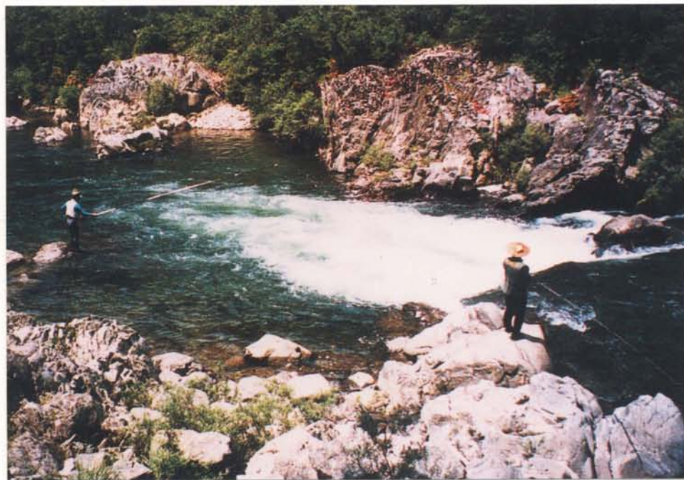
豊川（寒狭川）鳳来町

豊川上流域は、スギやヒノキ等の人工林を主体とする常緑針葉樹が大部分を占めているが、高位標高部には、シイ・カシ・ブナなどの落葉広葉樹林も一部残されているとともに、鳳来寺山のホソバシャクナゲや、 つげ 黄柳野地区のツゲの自生地 に 代表されるように各所で優れた自然植生がみられる。また、ニホンザル・イノシシ・キツネ・タヌキ・アナグマ等のほ乳類、ブッポウソウ・ヤマセミ・シジュウカラやレッドデータブック記載種のクマタカ等の鳥類、魚類では清冽な豊川のシンボルとしてアマゴ、イワナやアユが多く生息しているほか、国指定の天然記念物であるネコギギが生息し、ハコネサンショウウオ・モリアオガエル等の両生類や国蝶のオオムラサキをはじめギフチョウ・ムカシトンボなど学術上重要な種が生息している。