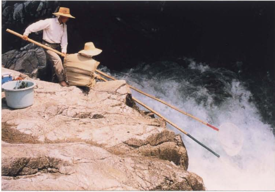
鮎滝（新城市） 滝を飛ぶ鮎を竿の先につけた網ですくい 捕らえる伝統漁法が現在も行われている。