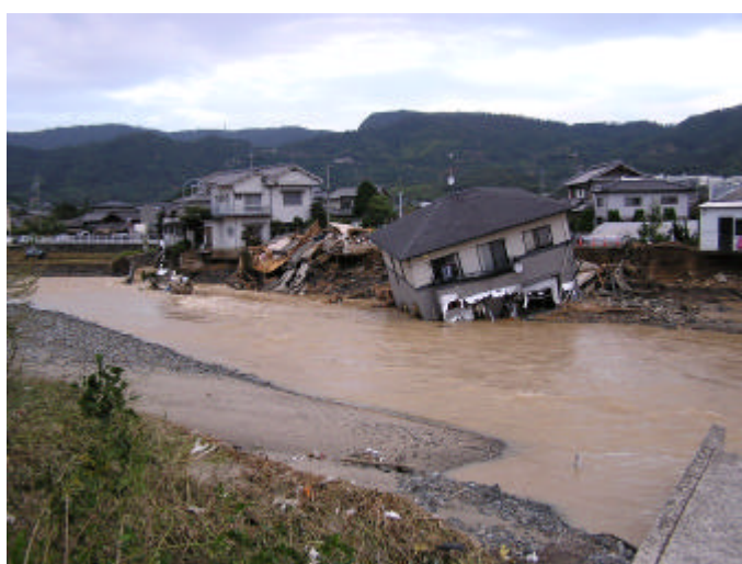
【洪水により損壊した家屋 (香川県高松市)】