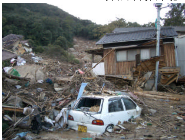
【土石流により損壊した家屋や車両 (岡山県玉野市)】