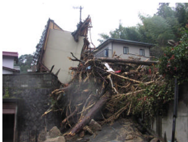
【土砂等の流出により損壊した家屋 (京都府宮津市)】