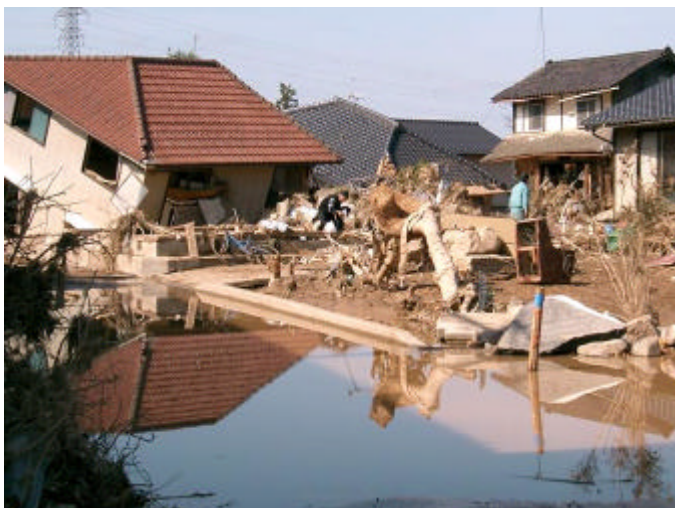
【破堤によるはん濫水により損壊した家屋 (兵庫県出石町)】