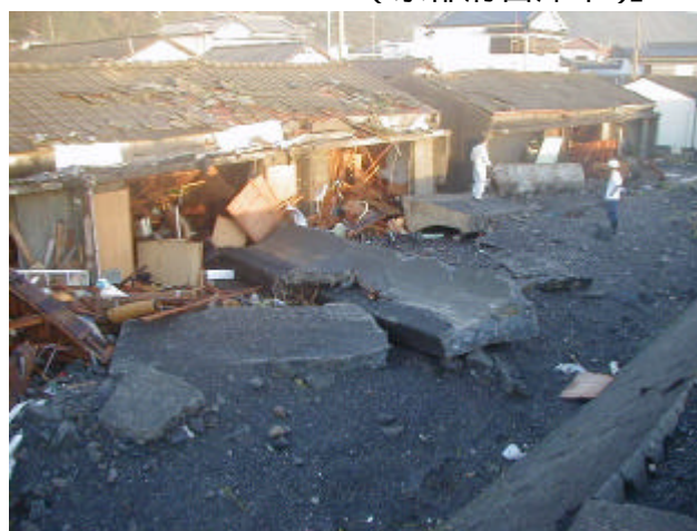
【高潮により損壊した家屋等 (高知県室戸市)】

死者 94 名、行方不明者 3 名 床上浸水 13,751 棟、床下浸水 39,007 棟 家屋全壊 773 棟、半壊 7,321 棟、一部破損 10,235 棟 公共土木施設被害：河川 9,828 件、海岸 43 件等 (1 月 14 日現在被害報告) 土砂災害発生件数 800 件