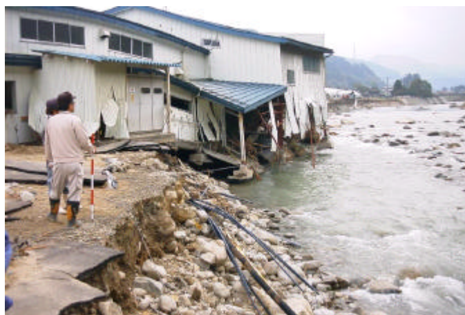
【河岸決壊により流失した工場 (岐阜県清見村)】