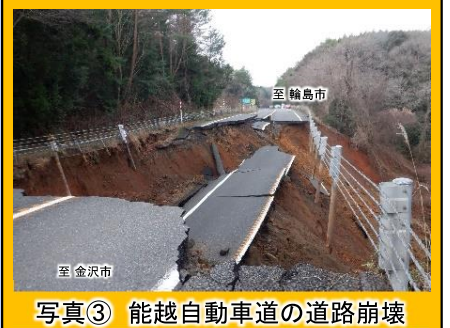
写真③ 能越自動車道の道路崩壊