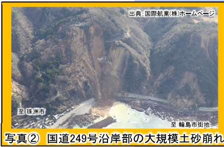
写真② 国道249号沿岸部の大規模土砂崩れ