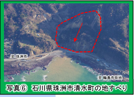
写真⑥ 石川県珠洲市清水町の地すべり