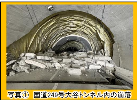
写真① 国道249号大谷トンネル内の崩落