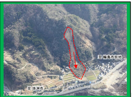
写真⑤ 石川県珠洲市仁江町の地すべり