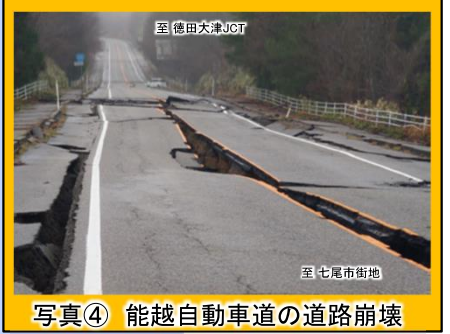
写真④ 能越自動車道の道路崩壊