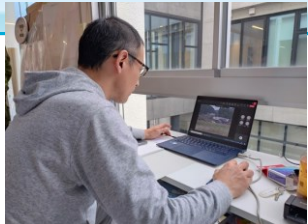
輪島市役所への映像配信 市役所職員による映像確認状況