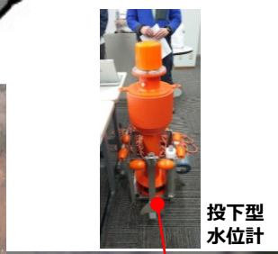
投下型水位計による監視状況 (鈴屋川(牛尾川))