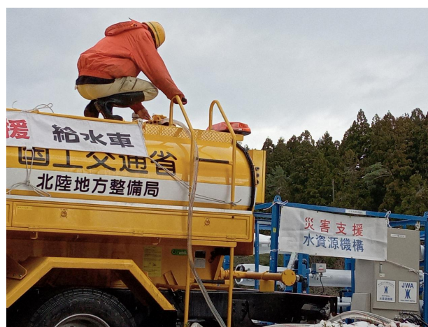
給水車へ注水状況