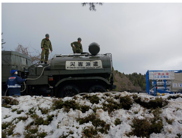
自衛隊給水車へ注水状況