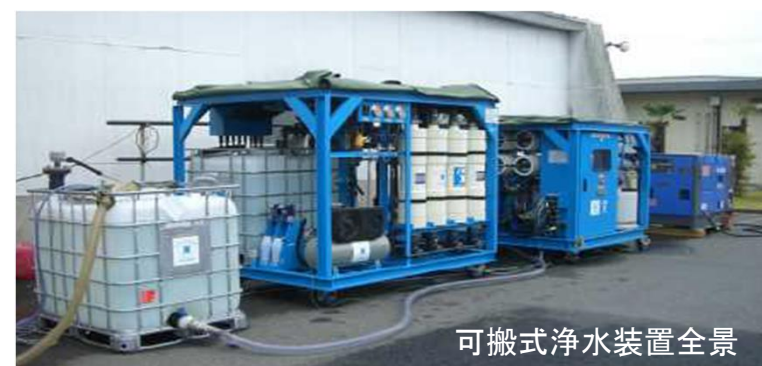
可搬式浄水装置全景