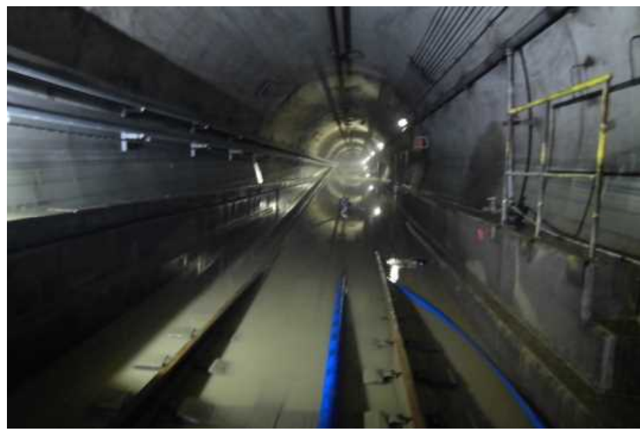
地下トンネルの浸水状況 18日14時頃