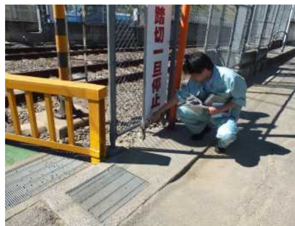
京阪電鉄沿いの痕跡水位