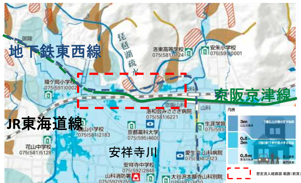
京都市防災マップ・水災害編 山科区版(抜粋)