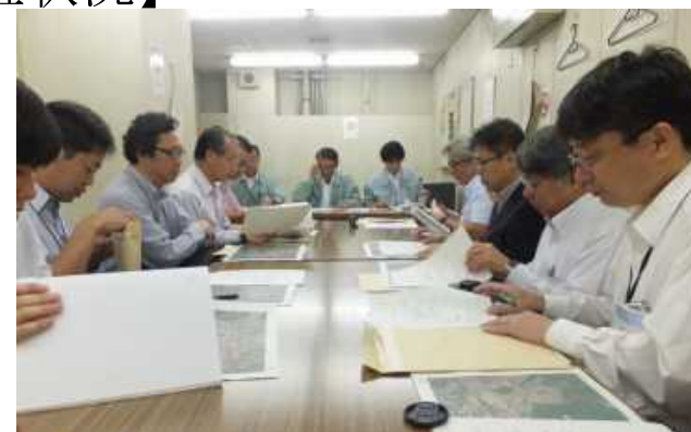
京都市交通局による浸水対応の説明状況