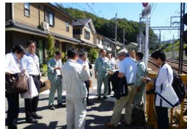
京阪電鉄沿いの視察状況