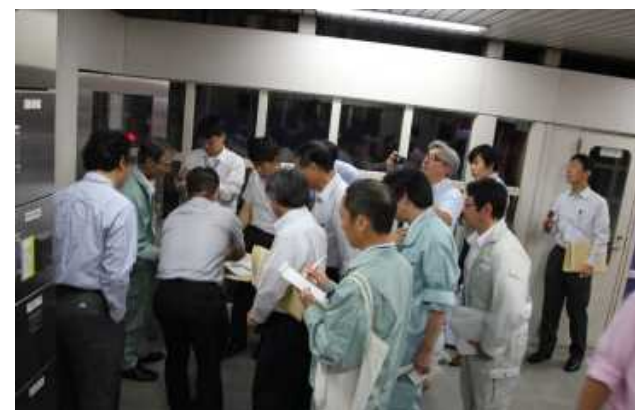
御陵駅構内視察状況