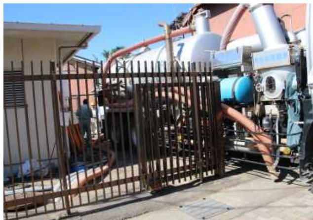
中間立坑からのポンプ車による浸水堆積物の排出状況