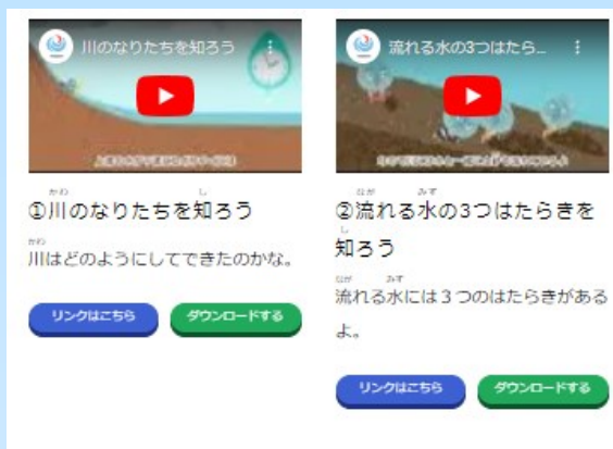
分かりやすい紹介文 「流れる水の働きと土地の変化について学ぼう」