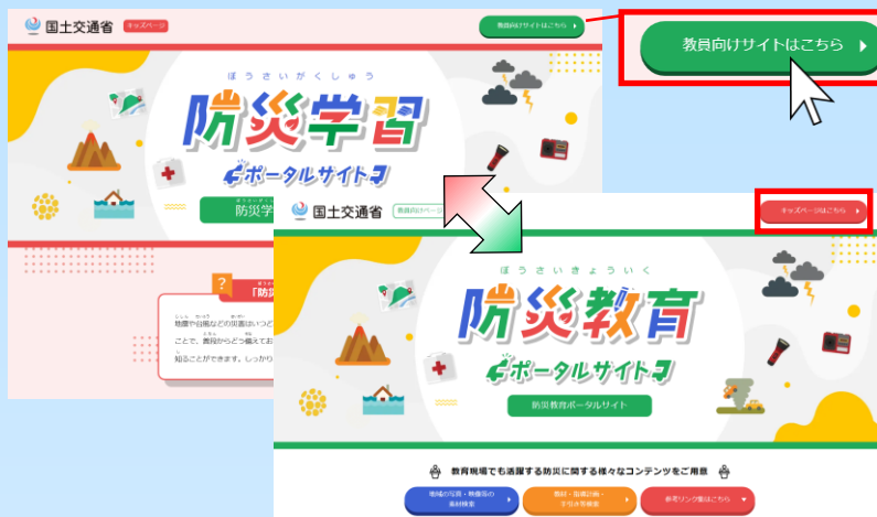
子ども向けページと教員向けページ