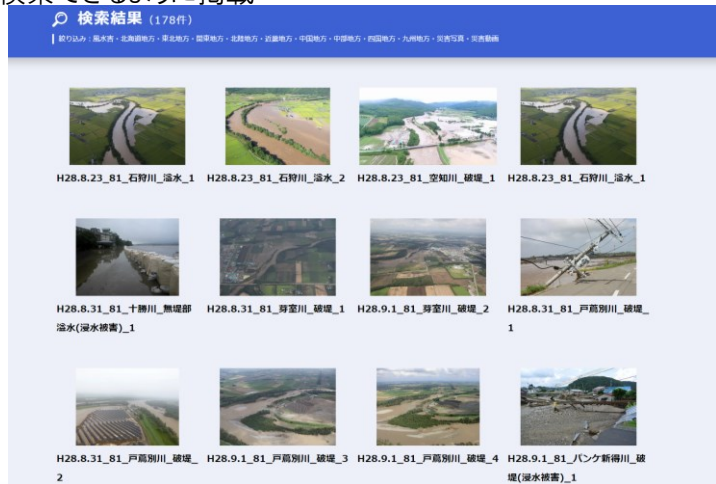
充実したデータ(写真・動画)