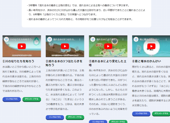
テーマごとに4分割した短時間動画