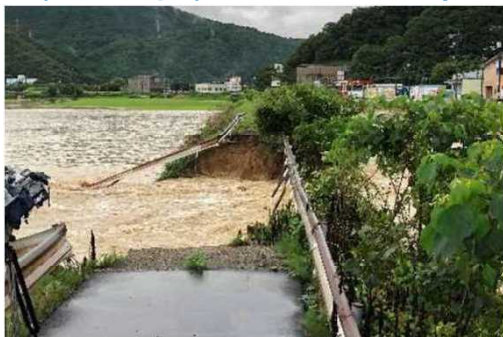
沼田川水系天井川の堤防決壊(広島県)