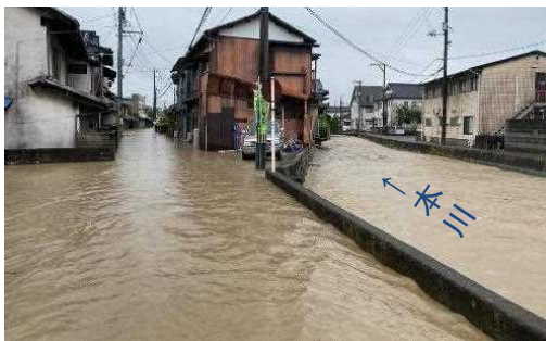
本川水系本川からの氾濫(広島県)