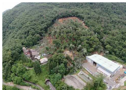
長野県長野市の地すべり