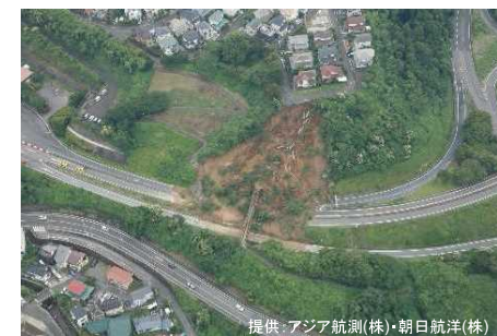
逗子ICにおけるのり面崩落(神奈川県)

※2 国土交通省「令和3年7月1日からの大雨による被害状況等について(第25報)」(令和3年12月2日)