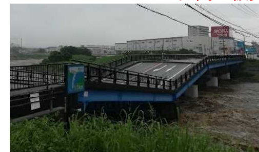
黄瀬川大橋の被害状況(静岡県)