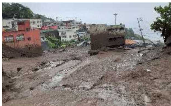
静岡県熱海市の土石流