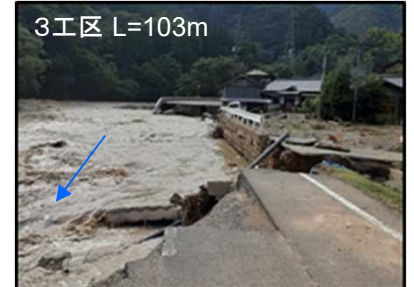
▲第3工区の被災状況