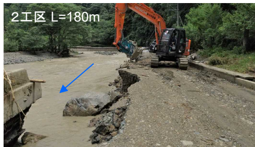
▲第2工区の被災状況