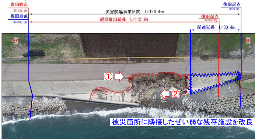
被災箇所に隣接したがい弱い残存施設を改良