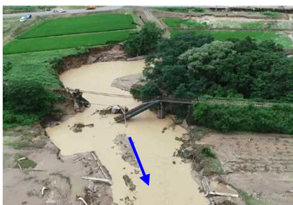
▲JR小白川橋梁被災状況