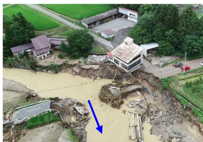
▲大巻橋落橋、家屋の被災状況